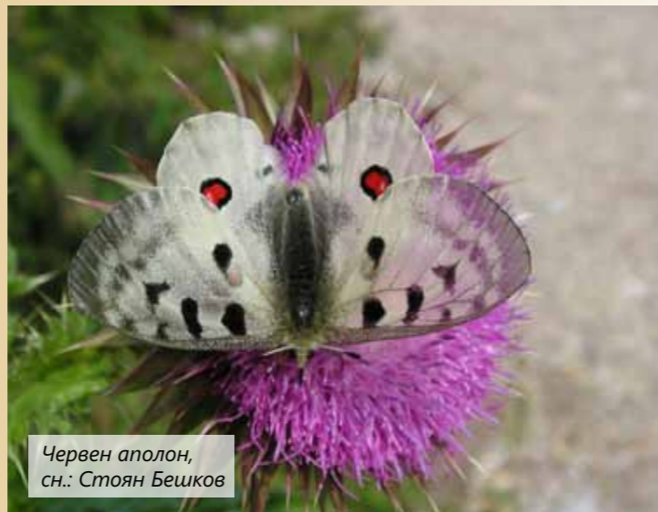
Червен аполон