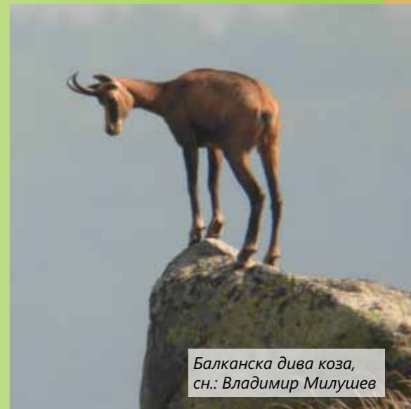
Балканска дива коза, сн.: Владимир Милушев