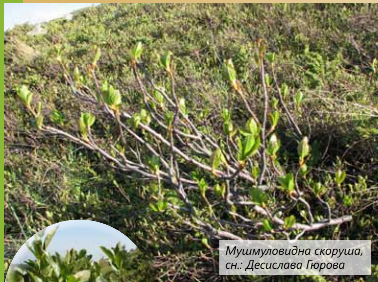
Мушмуловидна скоруша