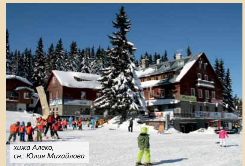
хижа Алеко

Предвидените дейности целят да подпомогнат утвърждаването и развитието на защитена зона „Витоша“ като елемент на европейската екологичната мрежа НАТУРА 2000.