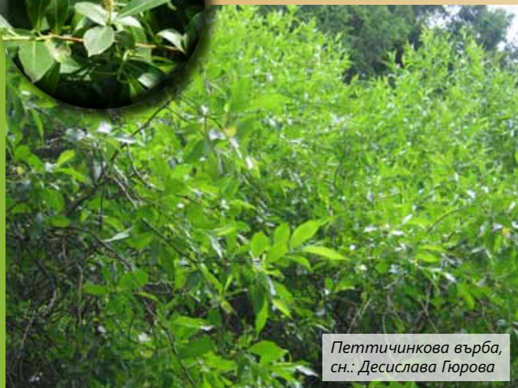
Петтичинкова върба