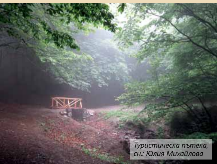
Туристическа пътека