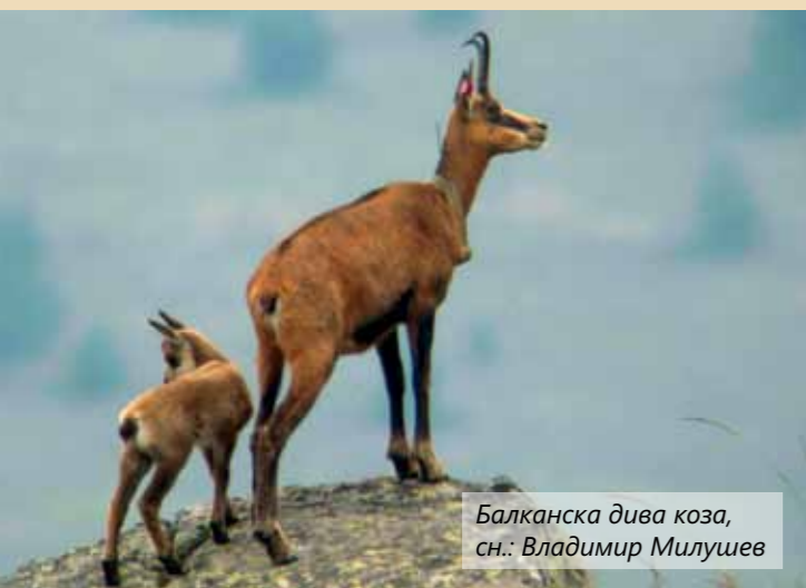
Балканска дива коза