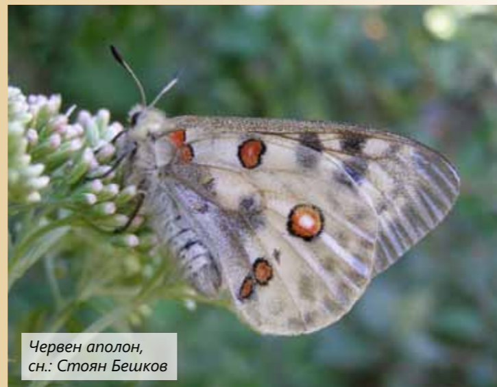
Червен аполон, сн.: Стоян Бешков

допринесе за стабилизиране на популацията. Предвидените поддържащи мероприятия за мечката и главоча са от голямо значение за оцеляването на популациите им и за подобряване на местообитанията им.