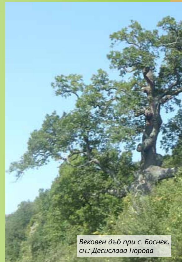
Вековен дъб при с. Боснек

Предвижда се разработване на специализирана кадастрална карта и на специализиран устройствен план на инфраструктурата в ПП Витоша, както и изготвяне на воден баланс за територията му . В Плана за управление на Природен парк Витоша са записани дейностите, свързани с определяне на необходимата територия за отдих извън туристическите центрове. За да бъдат определени тези територии, е необходимо да се направи кадастрално заснемане на всички обекти на туристическата инфраструктура (алеи, пътеки, стълбова маркировка, чешми за публично ползване, беседки, заслони и други). Използването на природни ресурси, включително питейни води и дървесина водят до съществени изменения в хидрологичния режим и намаляване площите на някои природни хабитати. Затова е от съществено значение да се изработи воден баланс, ГИС (географска информационна система) за водните обекти и хидротехническите съоръжения и хидрологичен модел за целите на интегрираното управление на водите в парка.