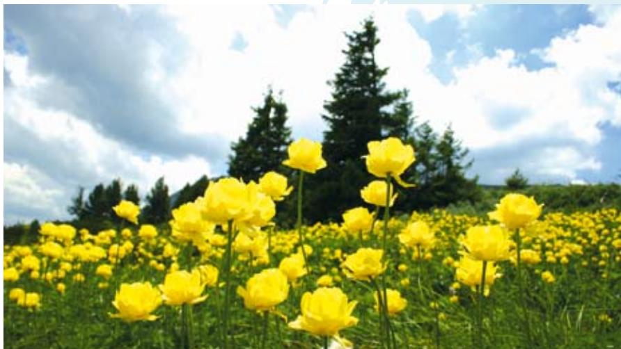
Витошко лале ( Trollius europaeus )