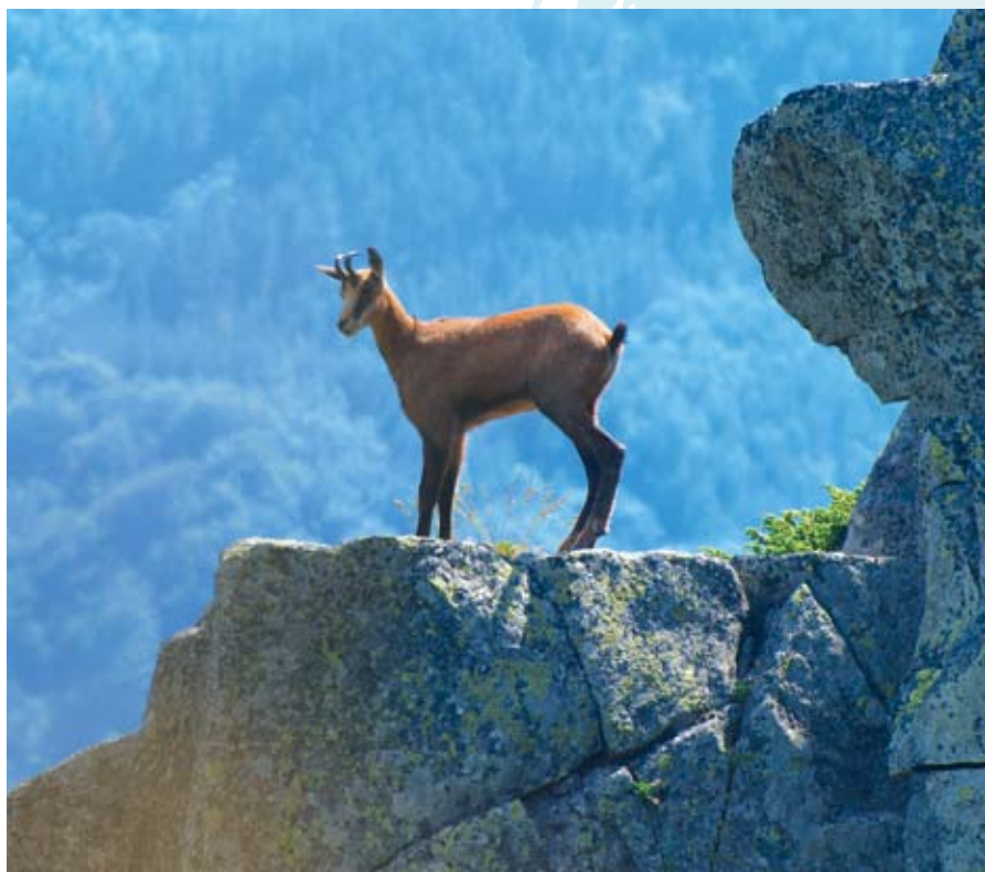
Балканска гива коза ( Rupicapra rupicapra balcanica ), сн. Ангел Дюгмеджиев