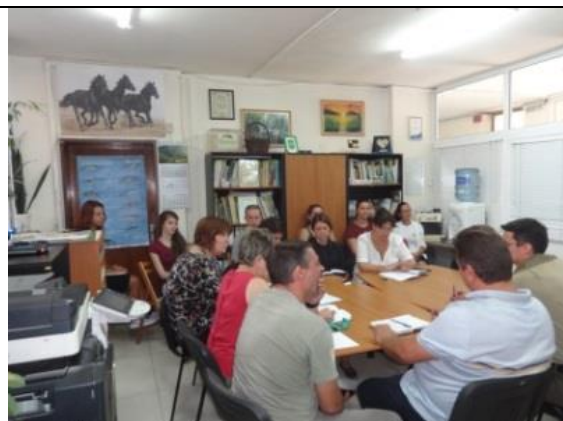
✓ Среща в ДПП „Витоша“ със студенти от Югозападен университет „Неофит Рилски“, специалност „Туризм“ на тема „Управление на защитени територии“: