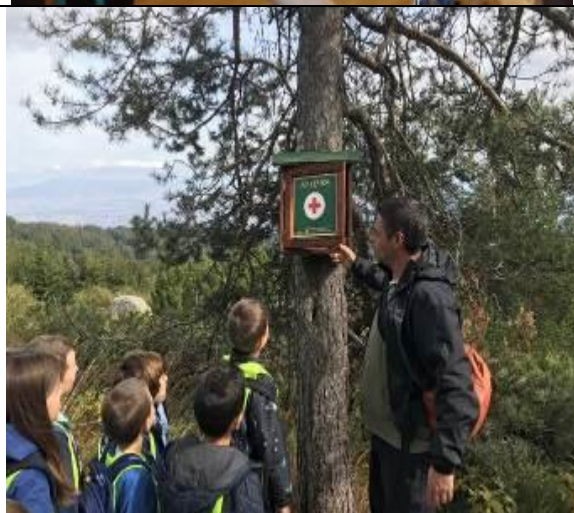
✓ Посещение на ученици по маршрут с. Железница – х. „Физкултурник“ - показване на растения и следи от животни: