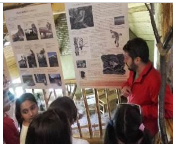
✓ Участие в празника за Деня на водата в 46-та детска градина „Жива вода“: