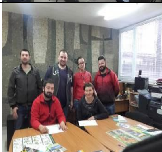
✓ Среща със студенти от СУ „Св. Климент Охридски“, специалност „Публична администрация“ на тема „Опазване на биологичното разнообразие в ПП „Витоша“: